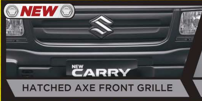
HATCHED AXE FRONT GRILLE

Tangguh dan kuat untuk bawa untung bisnis Anda.